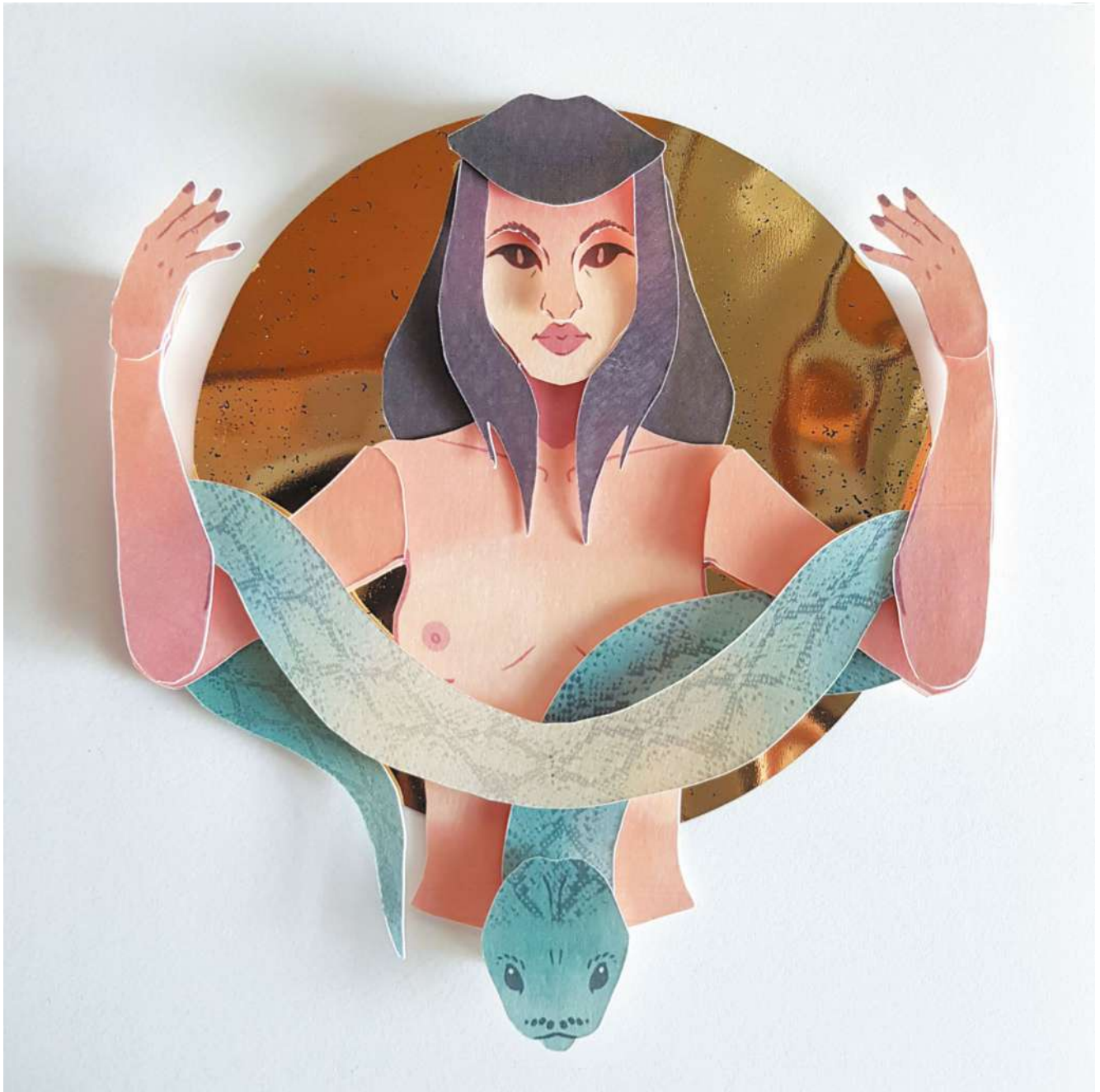
La Diosa - Exposición: La modelo y sus artistas 2019