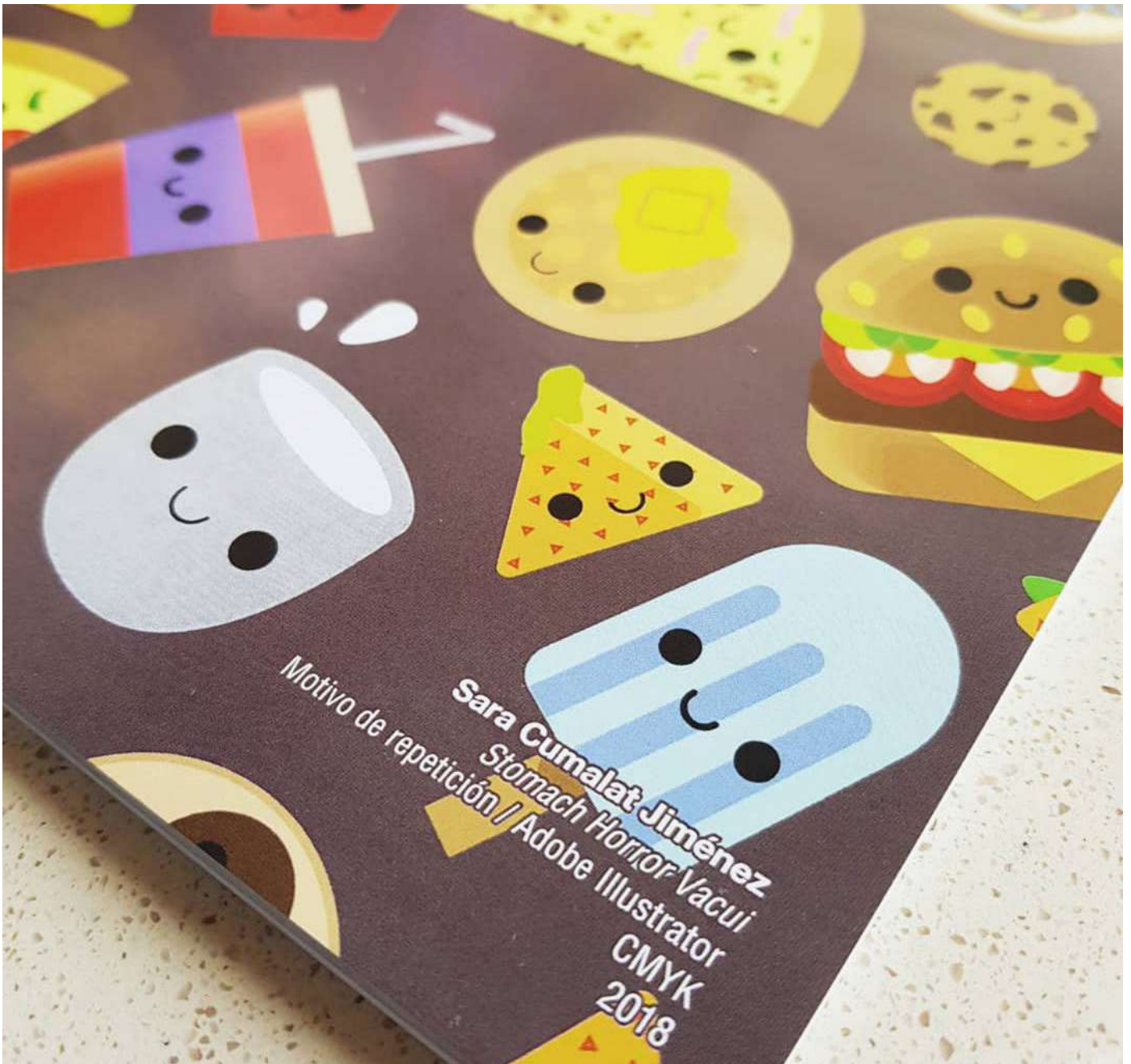
Artbook de Rapports - Arte, Diseño y Comunicación 2018 - Universidad de Sevilla