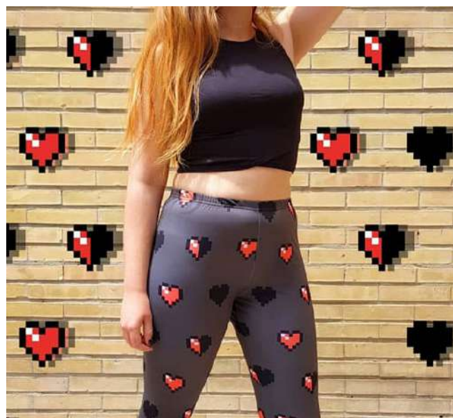
Merchandising: Textil, acrílico y pin de esmalte 2018