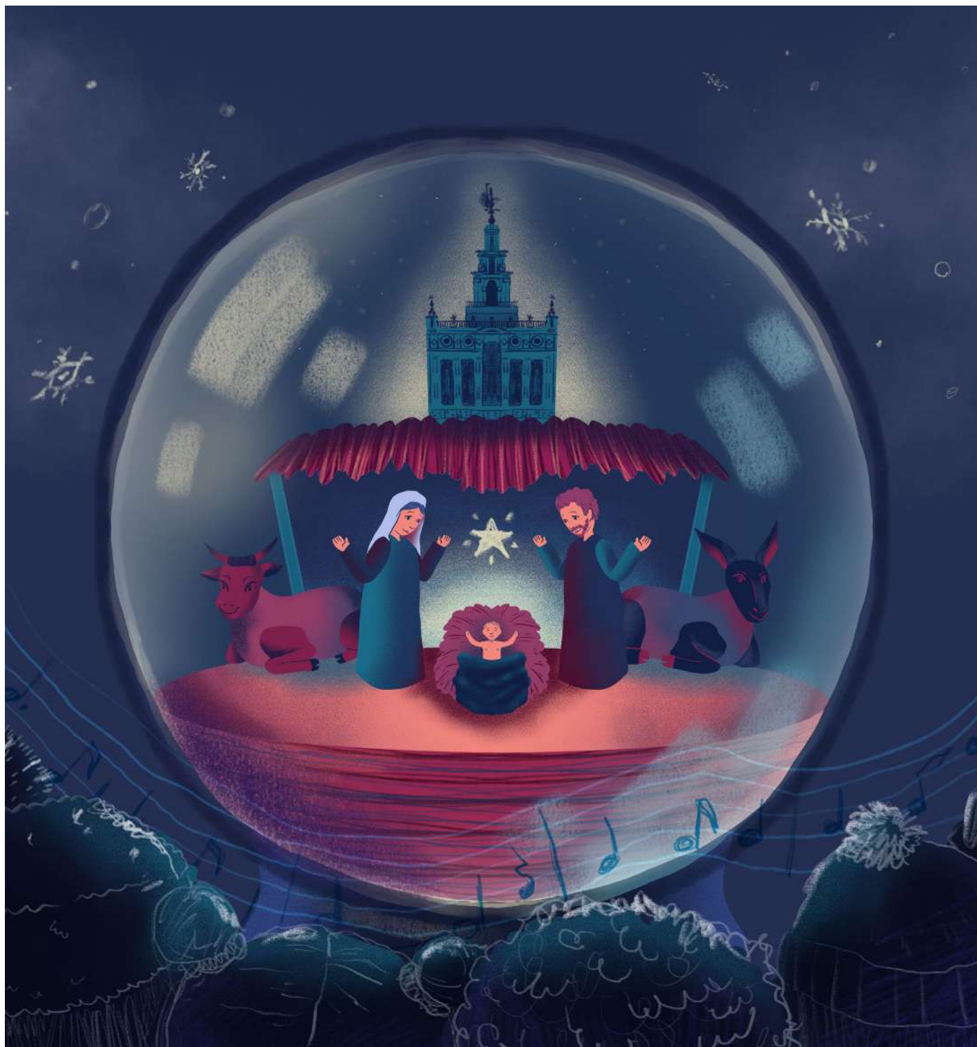
Los Gozos de Diciembre - Ilustración finalista del concurso Los Gozos de Diciembre - Cajasol - 2018