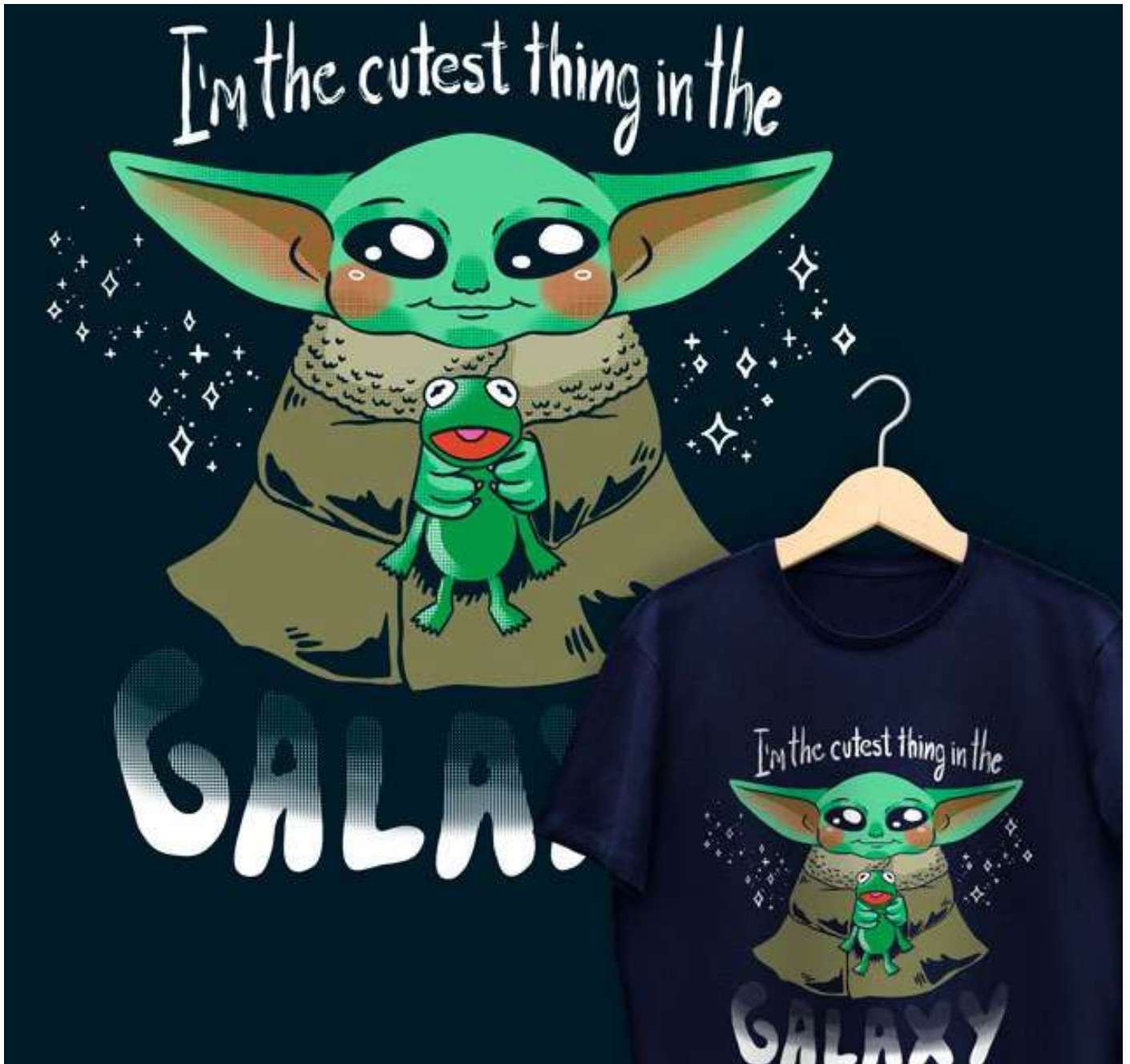
Ilustración de Camisetas Sevilla - 2020