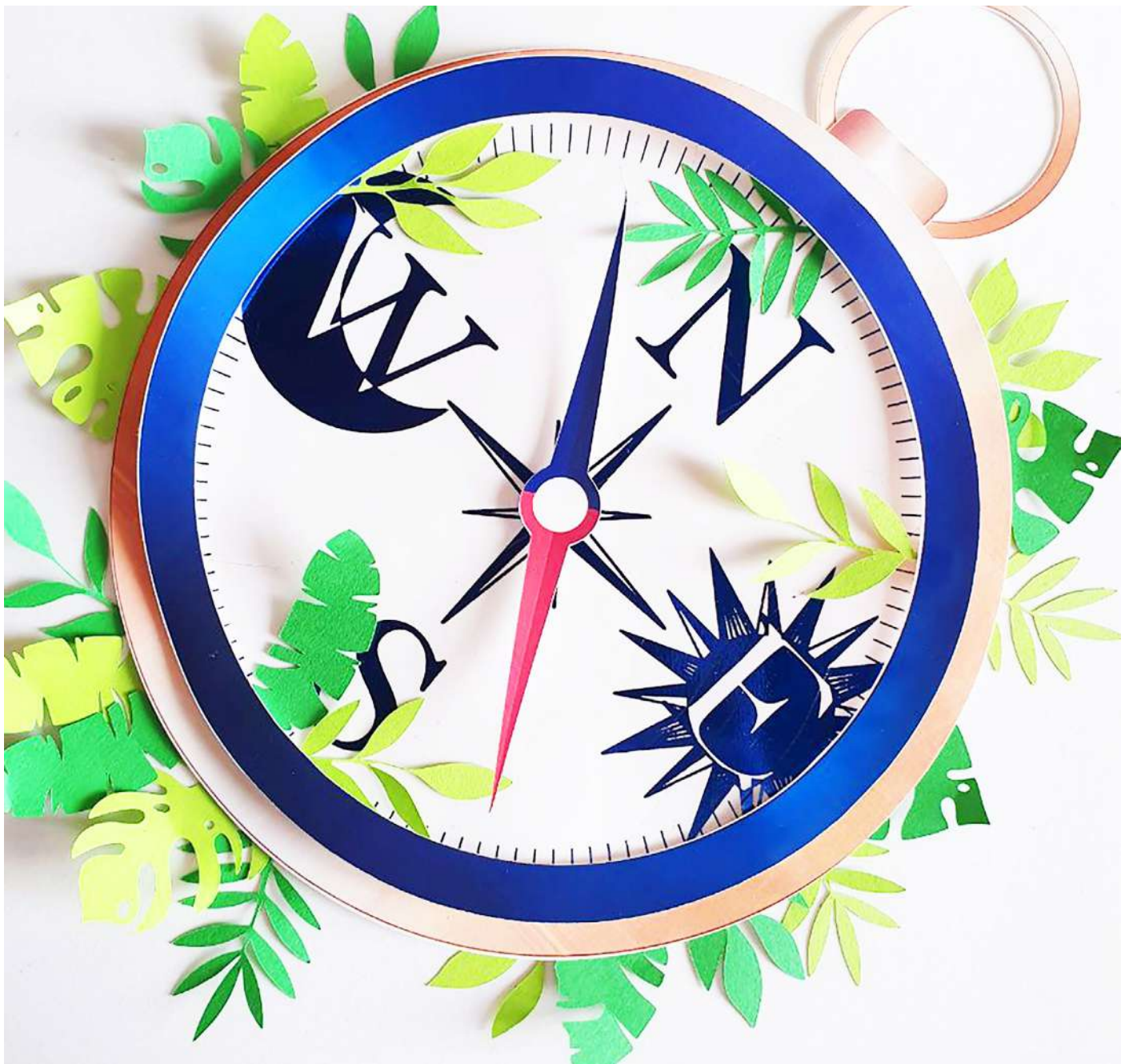
La Brújula - Exposición Circunnavegación 3.0 Sevilla - 2020